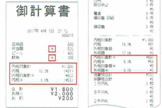
▲レシート(TE-2700-20S) ▲売上ジャーナル(TE-2700-20S)

※複数の税率(例10%と8%)が混在する精算に対応しているレジスターからの買い替えは、補助金の対象とはなりません。